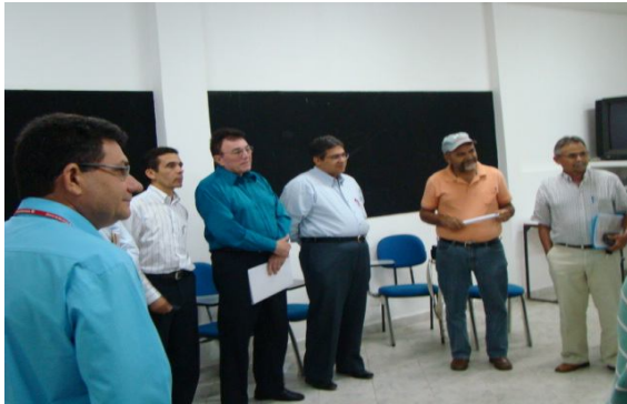
Representantes do BNB, BB, EMATER e EMEPA-PB.