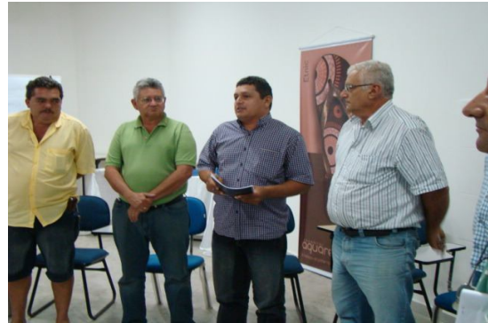
Representantes das Cooperativas BNB e EMATER.