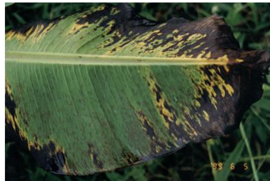
Sintoma avançado da Sigatoka-negra.