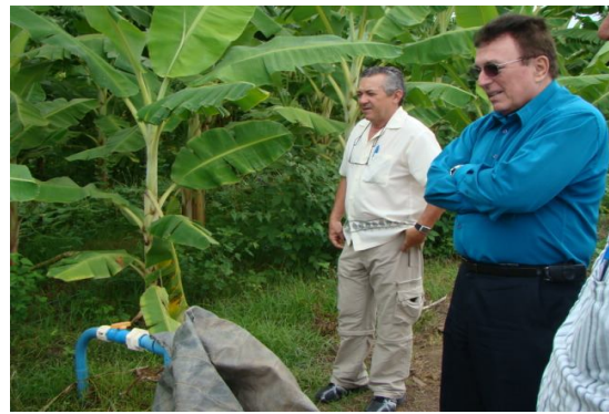
Representantes do BNB e EMATER em visita a lote de irrigado de banana, livre de Sigatoka-amarela nas Várzeas de Sousa.

O clima das Várzeas de Sousa é megatérmico do tipo tropical seco. A média térmica anual é 27°C com temperaturas que variam entre 18° na mínima e 38° na máxima. A umidade relativa do ar se situa entre 45% de setembro a fevereiro. A região é caracterizada por ser de área seca, recebe chuvas com mais frequência nos meses de janeiro a junho. A época mais seca se estende de setembro a dezembro. A média de precipitação anual é de 812.7 mm, com máximas de 730 mm. Esse tipo de clima no tocante à temperatura e umidade relativa, não é ideal para proliferação do fungo da Sigatoka - amarela em bananeira, que requer umidade relativa acima de 70% para germinação dos conídios e proliferar da enfermidade.