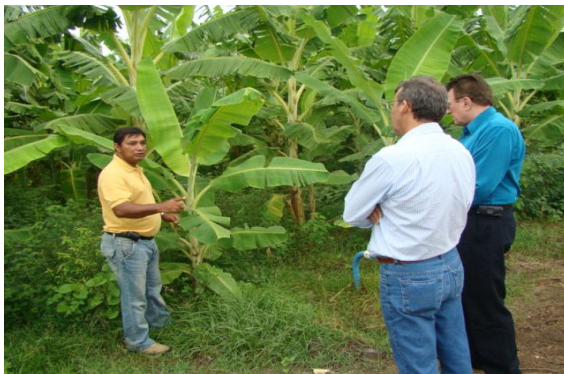
Representantes do BNB e EMEPA - PB em visita a lote irrigado de banana, livre de Sigatoka - amarela nas Várzeas de Sousa